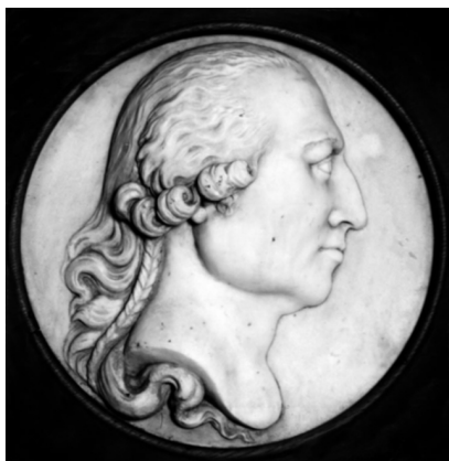
1) Johannes Wiedewelt: Portrætmedaljon i marmor fra Nicolaj Abraham Kalls gravminde på Assistens Kirkegård 1801, 40,5 cm. SMK.